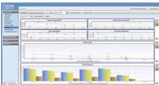
Controlling – Auswertung nach Kennzahlen