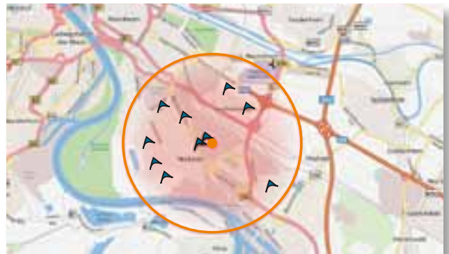
Neue Kundenpotenziale erschließen