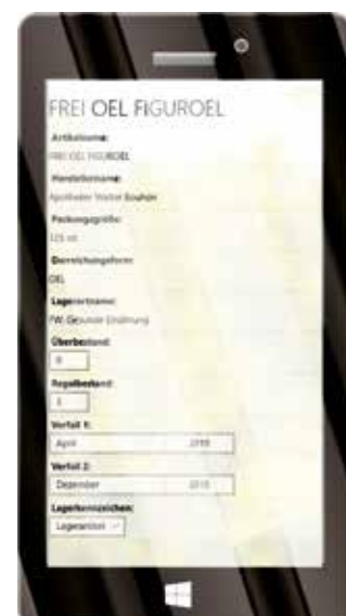
Schematische Darstellung ADGCOACH 3 TO-GO